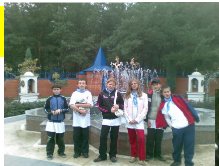
Бронзові призери змагань