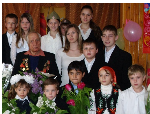
День Перемоги — свято не лише для ветеранів

Ветерани війни. Їх залишилося так мало. Вдивіться в їхні обличчя, прислухайтеся до їхніх голосів. Вони так хочуть, аби їх почули і зрозуміли. А в ваших душах, сподіваємось, зародяться нові почуття.