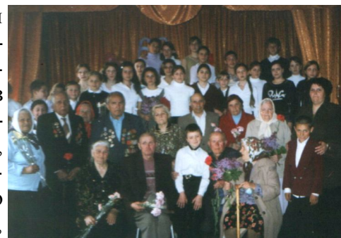
Ветерани війни — часті гості нашої школи

Друже! Ніколи не проходь байдужим повз могили, пам'ятники, обеліски! Згадай їх