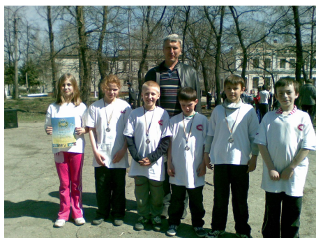
Срібні призери змагань