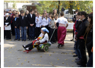
Весело і гомінко на шкільному ярмарку